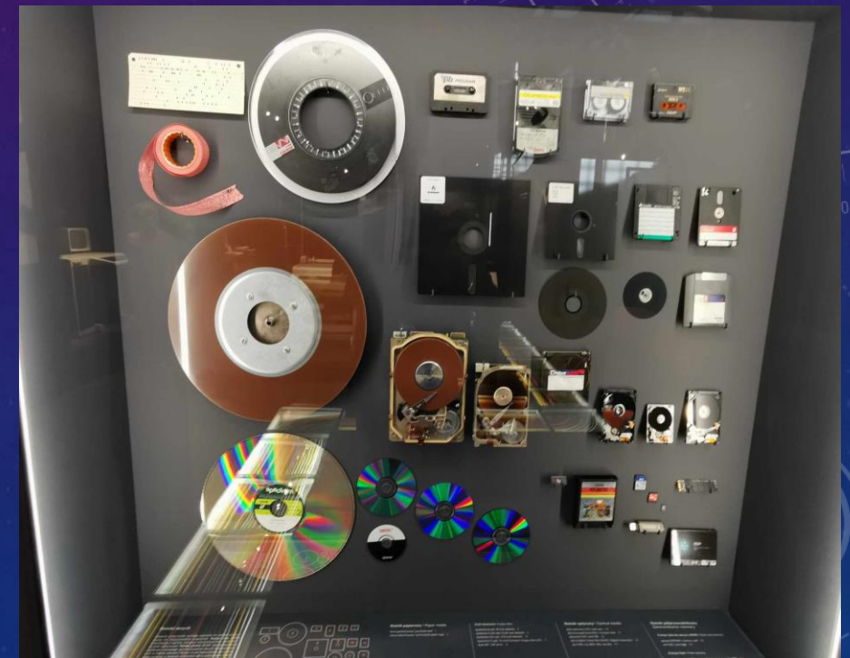
(Adatot tároló eszközök a Krakkói Műszaki Múzeumban)

A rengeteg szakmai ismeret mellett kulturális ismeretünk is gyarapodhatott. Meglátogattuk a Krakkói Műszaki Múzeumot, ahol megtekinthettük Krakkó régi villamosait, és végignézhettük a város műszaki fejlődését egy kisfilmben.