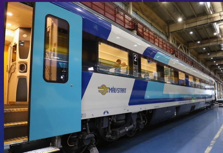
Szerelvényünk, a MÁV InterCity

Utunk 2023. július 1-én kezdődött. Az első része utazásunknak a buszozás volt, az SzC kisbuszaival. A Nyugati pályaudvarra érkezéskor ellenőriztük csomagjainkat, majd felszálltunk a vonatra.